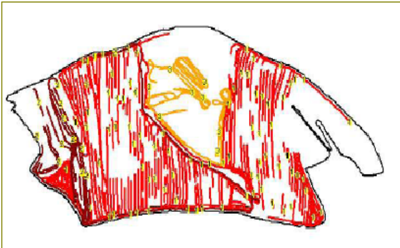
Carte de marquage des mauvaises herbes réalisée lors du fauchage Une couleur différente pour chaque espèce pourrait être utilisée.

À cette étape, il est important de s'assurer que les données que l'on récupère pourront être facilement traitées par la suite . Par exemple, il est important de travailler dans le même système de coordonnées géodésiques (ex. : WGS 84) lorsqu'un système différent est utilisé lors de l'identification des mauvaises herbes et lors de l'application localisée.