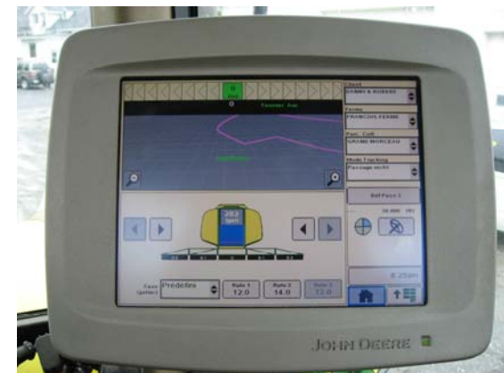
Écran GPS à bord du tracteur