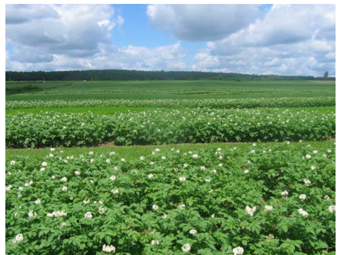
Parcelles de pomme de terre

Ces résultats montrent que les engrais verts d'été ont produit deux à quatre fois plus de matière sèche et prélevé plus d'azote du sol que les engrais verts d'automne. La période de croissance plus longue pour les engrais