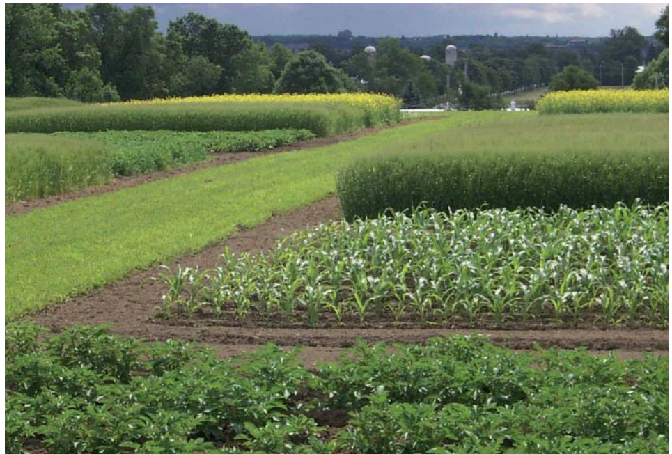
Parcelles de différentes cultures de rotation

Les engrais verts d'automne ont par contre produit de faibles quantités de biomasse végétative, soit 1,2 tonne/ha en moyenne, et prélevé du sol de faibles quantités d'azote (50 kg/ha en moyenne). Ces résultats sont attribuables aux abondantes précipitations survenues à la fin du mois d'août qui ont retardé les semis (16 septembre), et aux températures fraîches et pluvieuses de septembre et d'octobre qui ont défavorisé la croissance des plantes.