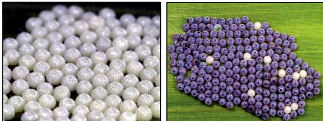
Figure 1. Masse d'œufs fraîchement pondus (gauche) et près à éclore (droite)