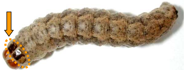
Figure 2. Larve mature avec deux bandes foncées sur le pronotum.