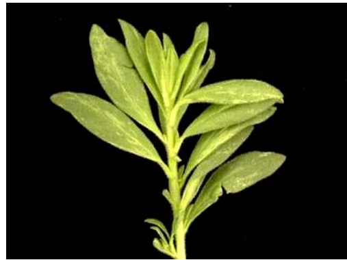
Photos 9-10 : CbMV sur Calibrachoa : feuilles tachetées ou marbrées avec des tons de vert et de jaune clair