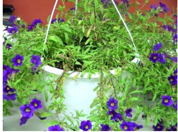
Photos 7-8 : TMV-ToMV sur Calibrachoa ; les paniers se dégarnissent car les feuilles sèchent