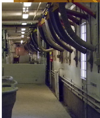
Bâtiments porcins.