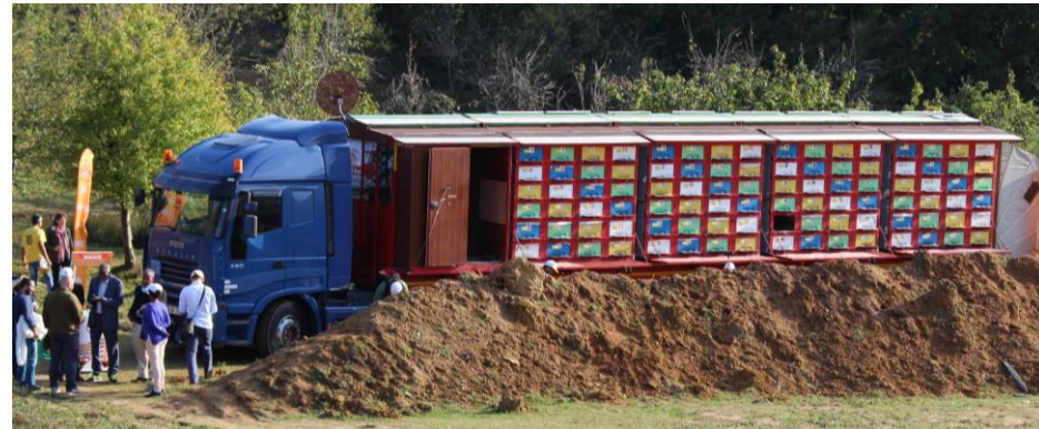
Apis mellifera anatoliaca