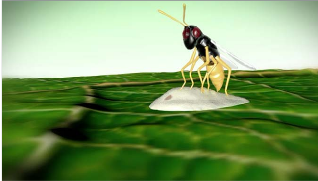
Figure 8: Illustration d'une guêpe parasitoïde qui pique et tue un aleurode immature.