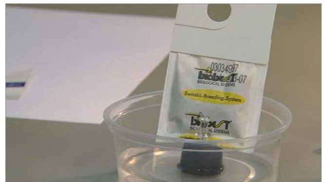
Figure 7: Évaluation de la viabilité d'un acarien prédateur ( Amblyseius swirskii ). Les prédateurs qui émergent sont comptés à chaque semaine.