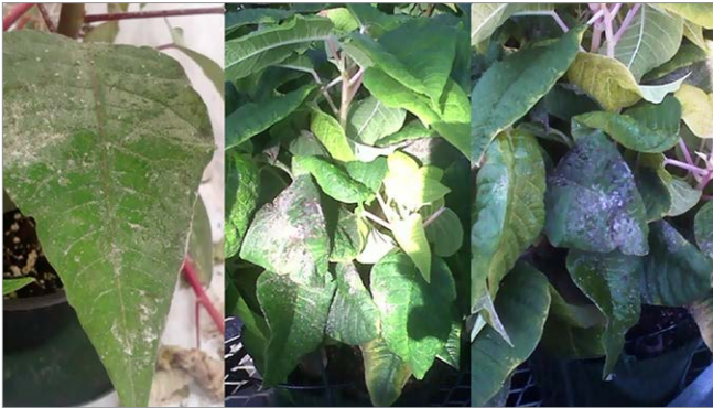
Figure 4: Moisissure charbonneuse noire sur les feuilles de poinsettia causée par une infestation d'aleurodes.

La deuxième vidéo veille à Mettre en œuvre des pratiques de lutte biologique contre les aleurodes dans les cultures de poinsettias – Cette vidéo présente plusieurs méthodes de lutte biologique actuellement disponibles qui peuvent contribuer à la lutte contre l'aleurode dans le cadre d'un programme de LAI. Les visualiseurs sont renseignés sur le type d'emballage dans lequel les agents sont expédiés ( Figure 5 ), les meilleures méthodes d'entreposage et leur durée de vie en serre. Ils apprennent comment, quand et où appliquer les agents dans la serre afin d'obtenir des résultats fructueux ( Figure 6 ). On leur montre comment évaluer la qualité du produit lorsque celui-ci arrive et comment évaluer son activité dans la culture ( Figure 7 ). La vidéo montre également comment le prédateur agit sur sa proie ( Figure 8 ). Les agents de lutte biologique présentés sont notamment les guêpes parasitoïdes Encarsia formosa , Eretmocerus mundus et Eretmocerus eremicus , l'acarien prédateur Amblyseius swirskii , la coccinelle noire Delphastus catalinae , ainsi que les biopesticides entomopathogènes Beauveria bassiana et Isaria fumosorosea ( Figure 9 ).