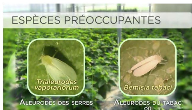
Figure 2: Deux espèces d'aleurodes nuisibles dans la production de poinsettia en serre: Trialeurodes vaporariorum and Bemisia tabaci .

La première vidéo veille à Surveiller les aleurodes dans les cultures de poinsettias – Dans la vidéo, les visualiseurs peuvent apprendre comment identifier correctement et surveiller deux espèces d'aleurodes [aleurode des serres ( Trialeurodes vaporariorum ) et aleurode du tabac ( Bemisia tabaci )] sur des poinsettias à différents stades de production en serre (Figure 2). Étant donné que les boutures non racinées provenant de l'étranger contiennent parfois des œufs et des larves de Bemisia ; il est primordial de faire une inspection minutieuse du matériel végétal au moment de sa réception, puis à intervalles réguliers durant la production (Figure 3). On montre aux visualiseurs ce qui distingue les deux espèces sur le plan morphologique et comment elles peuvent endommager les plants (Figure 4). On montre également aux visualiseurs comment intégrer d'autres tactiques, comme l'installation de pièges collants jaunes afin de localiser les zones problématiques.