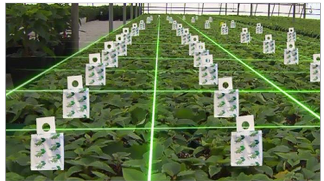
Figure 6: Distribution de sachets d'agent de lutte biologique dans une culture en serre.