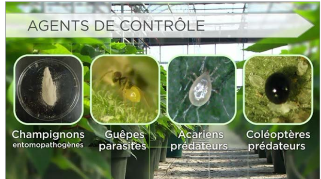
Figure 9: Types d'agents de lutte biologique figurant dans les vidéos.

Les vidéos et le site Web ont été possibles grâce à des fonds fournis par CLA-AAC, l'Organisation Internationale pour la lutte biologique - section régionale néarctique, et le programme d'innovation agricole de l'Ontario, avec la collaboration de Flowers Canada Growers, le Centre de recherche et d'innovation de Vineland et MAAARO.