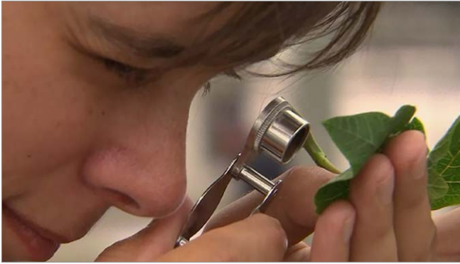
Figure 3: Loupe simple utilisée pour examiner l'envers de boutures pour la présence d'œufs, de larves et d'adultes d'aleurodes.