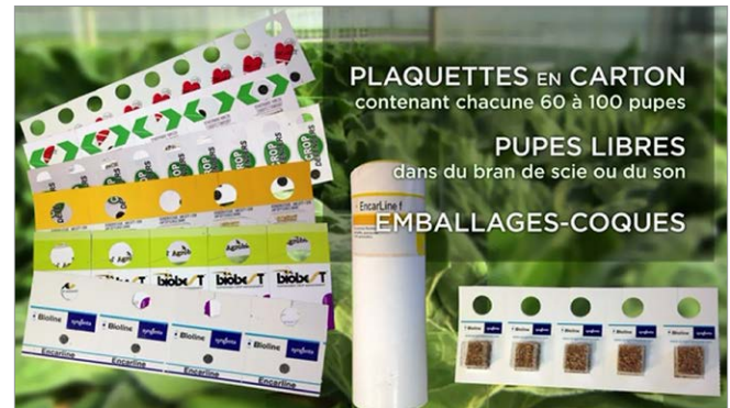
Figure 5: Agents de lutte biologique emballés dans plusieurs différents formats.

La troisième vidéo présente des Expériences réussies dans le domaine de la lutte biologique – Dans la vidéo, les producteurs qui utilisent des agents de lutte biologique dans leur production en serre font part de leur expérience réussie et discutent des avantages de la lutte biologique par rapport aux pesticides chimiques conventionnels dans la lutte antiparasitaire. Il a été démontré que l'augmentation des taux d'adoption des techniques de LAI, comme la lutte biologique, est largement influencée par les échanges entre producteurs.