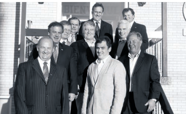
Les signataires du protocole d'entente en vue d'une nouvelle convention de mise en marché, à Rivière-du-Loup, en 2008.