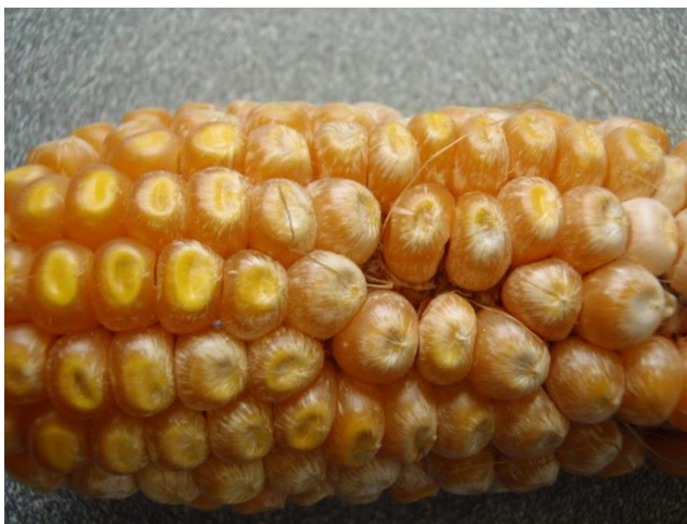
Figure 3 : Symptômes de la fusariose de l'épi et des grains causée par Fusarium verticillioides