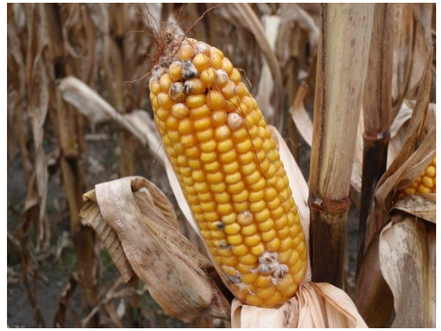
Figure 2 : Symptômes de la fusariose de l'épi et des grains causée par Fusarium verticillioides