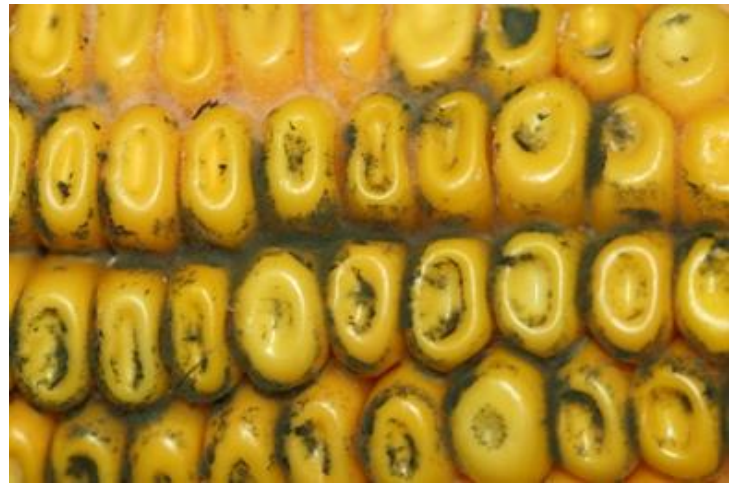
Figure 8 : Symptômes de la moisissure noire causée par Cladosporium spp. autour des grains et sur les grains de maïs