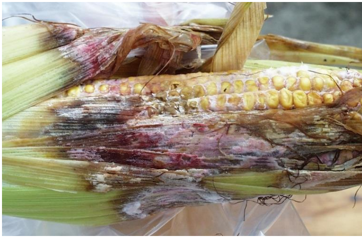
Figure 1 : Symptômes de la fusariose de l'épi causée par Gibberella zeae