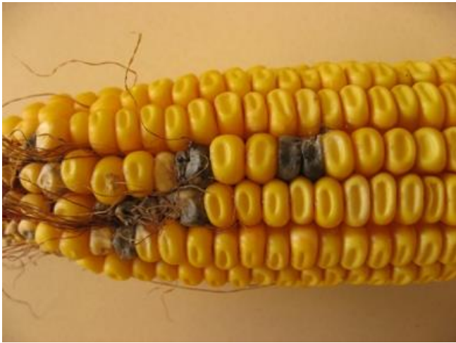
Figure 7 : Symptômes de la moisissure noire causée par Cladosporium spp., soit des grains de maïs noircis à quelques endroits sur l'épi