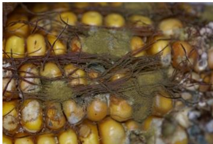
Figure 11 : Symptômes de la pourriture des grains causée par Aspergillus flavus