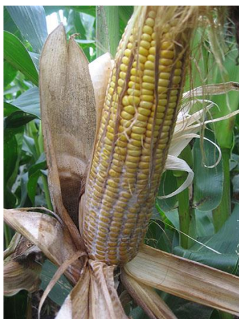
Figure 5 : Symptômes de la pourriture sèche causée par Diplodia maydis