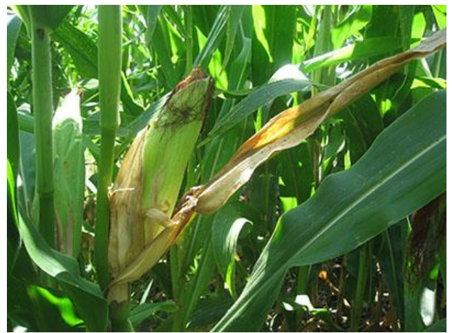
Figure 4 : Spathe externe morte signalant la présence de la pourriture sèche de l'épi causée par Diplodia maydis