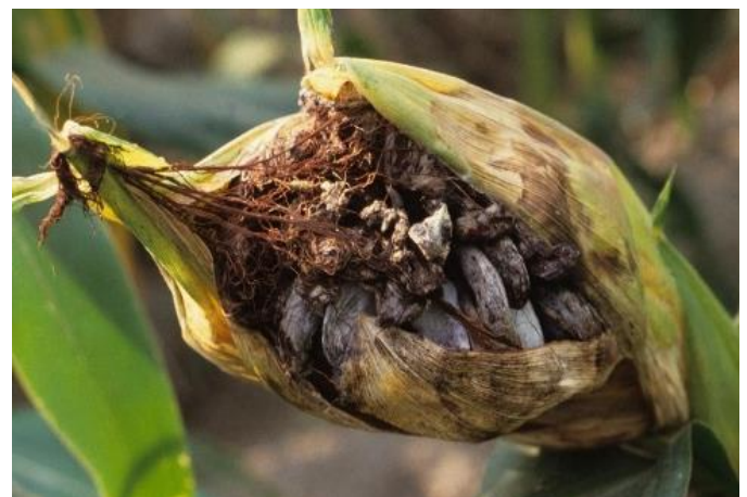
Figure 6 : Symptômes du charbon commun causé par Ustilago zeae