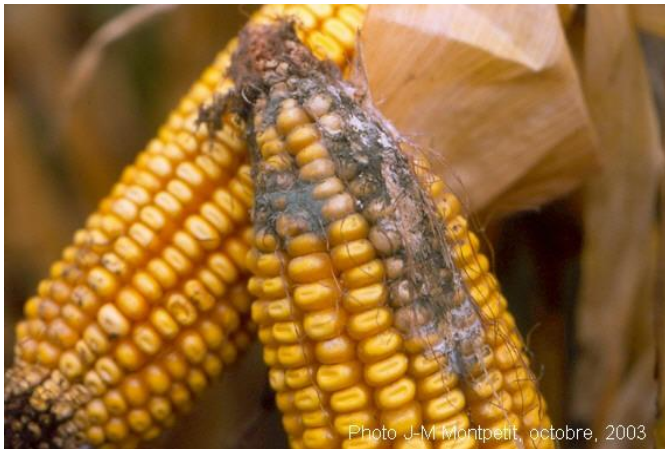
Figure 9 : Symptômes de moisissures vertes causées par Penicillium spp.