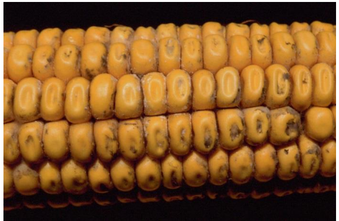
Figure 10 : Symptômes de moisissures vertes causées par Trichoderma spp.