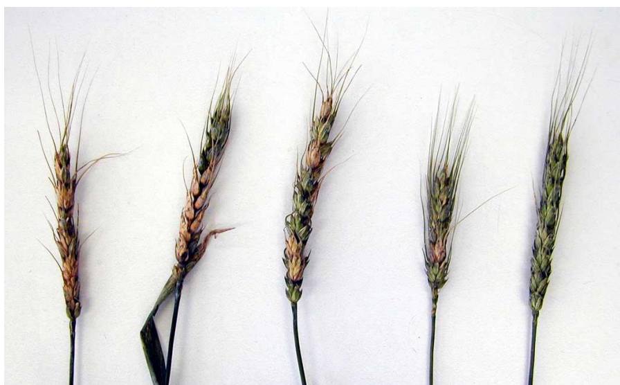
Photo 5 : Symptômes de la fusariose de l'épi du blé; les épis montrent plus ou moins d'épillets affectés.