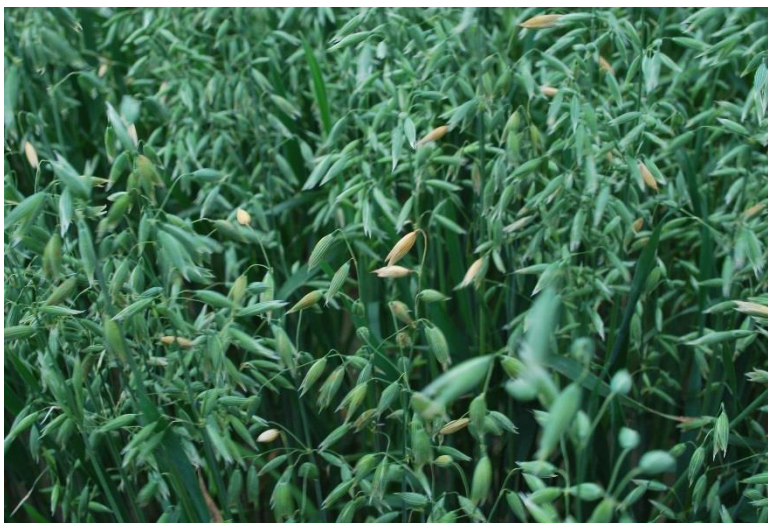
Photo 13 : Avoine infectée par la fusariose. Il est courant que l'infection se manifeste au sommet de la panicule plutôt que d'affecter de façon aléatoire les épillets sur toute l'inflorescence.