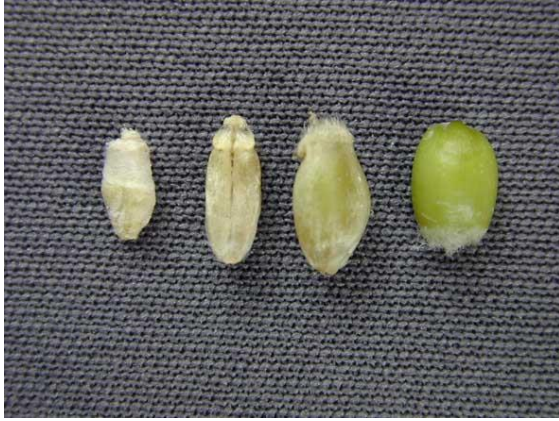
Photo 1 : Gros plan de grains en remplissage, plus ou moins fusariés, et d'un grain sain (à droite)