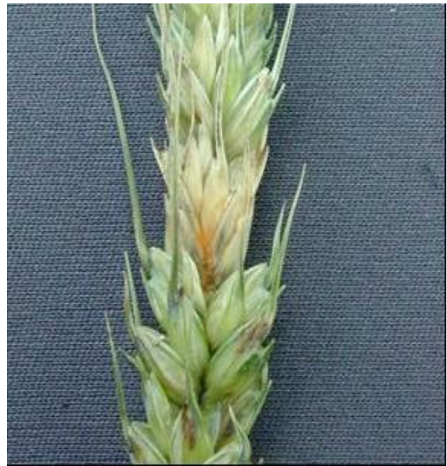
Photo 4 : Fusariose de l'épi du blé; la teinte orangée dénote la présence du champignon pathogène.