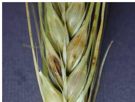
Photo 6 : Fusariose de l'épi chez l'orge; les taches brunes dénotent la présence du champignon.