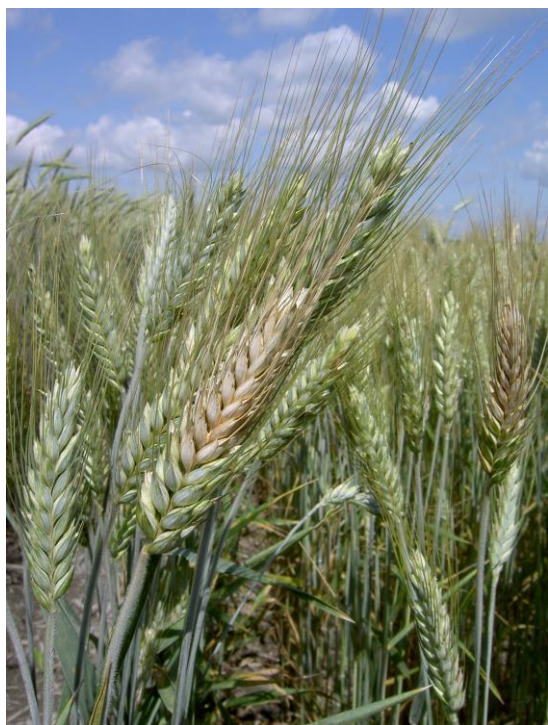
Photo 14 : Fusariose de l'épi chez le triticale