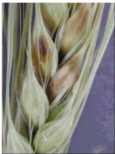
Photo 9 : Fusariose de l'épi chez l'orge; la teinte rosée dénote la présence du champignon pathogène.