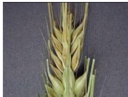
Photo 8 : Fusariose de l'épi chez l'orge