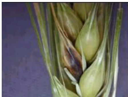
Photo 7 : Fusariose de l'épi chez l'orge