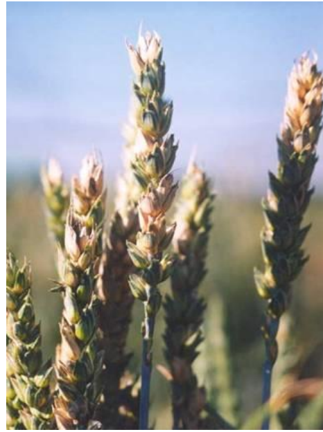
Photo 2 : Fusariose de l'épi du blé; épillets décolorés