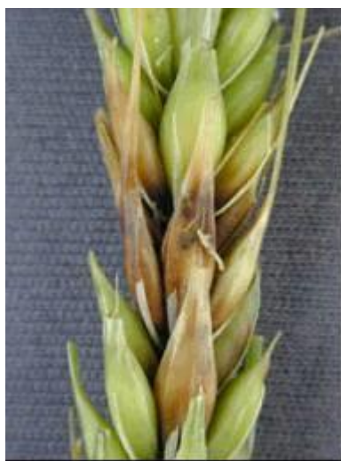
Photo 10 : Épi d'orge fusarié; symptômes peu courants chez l'orge.