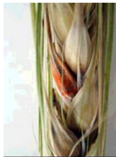
Photo 11 : Épi d'orge fusarié; symptômes rares chez l'orge.