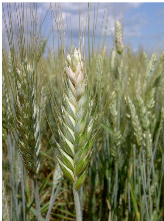
Photo 15 : Fusariose de l'épi chez le triticale