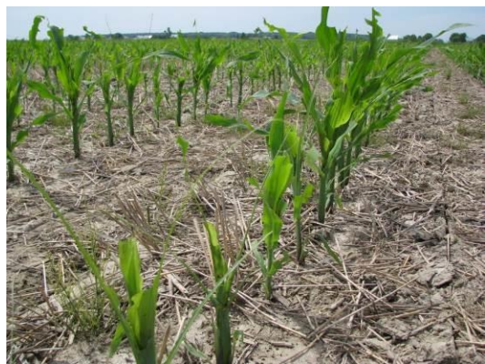
Figure 11 : Champ de maïs avec dommages de légionnaire uniponctué