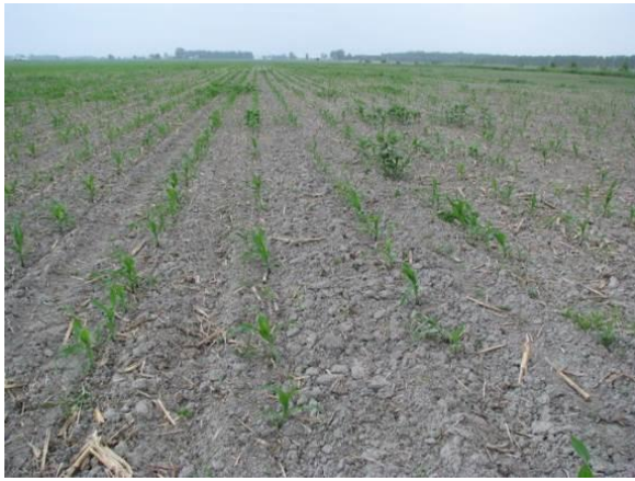
Figure 7 : Champ de maïs avec dommages de ver-gris noir