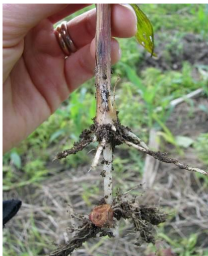
Figure 13 : Fonte des semis