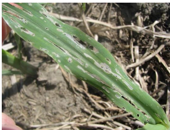
Figure 16 : Dégâts dus aux limaces