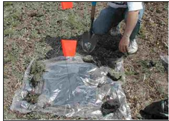
Figure 4 : Installation du polythène (si besoin, pour réchauffer le sol)