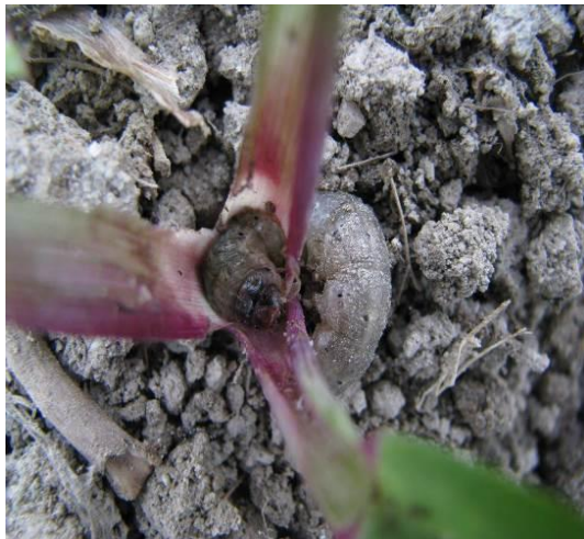
Figure 9 : Larves de vers gris-noir dans la tige et au sol