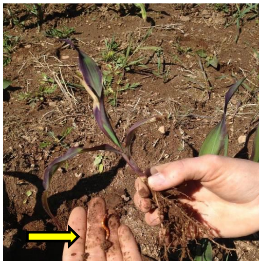
Figure 1 : Plant bleui et présence d'un ver fil-de-fer

Vous pouvez consulter le Guide des ravageurs de sol en grandes cultures pour des photos et des informations plus détaillées sur les ravageurs et leurs dommages. Lorsqu'un ou des plants semblent affectés, il est recommandé de creuser à la base des plants afin de vérifier la présence d'insectes. D'autres facteurs peuvent causer les dommages observés (maladies, carences, dérive d'herbicide, etc.).