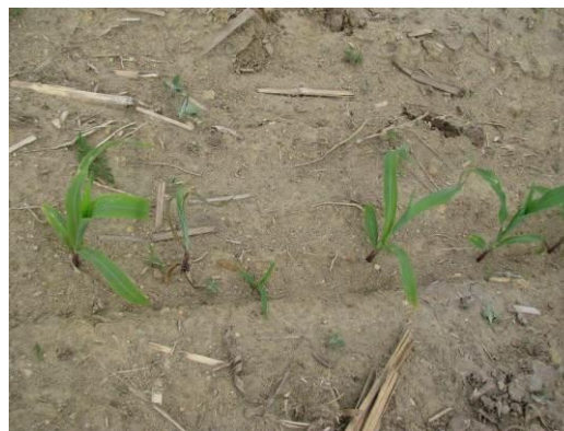
Figure 6 : Plants en retard de croissance dû aux hannetons