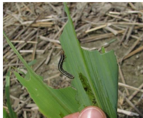
Figure 12 : Larve de légionnaire uniponctué s'alimentant sur un plant de maïs