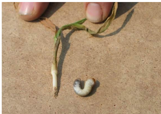
Figure 5 : Plant grugé et hanneton