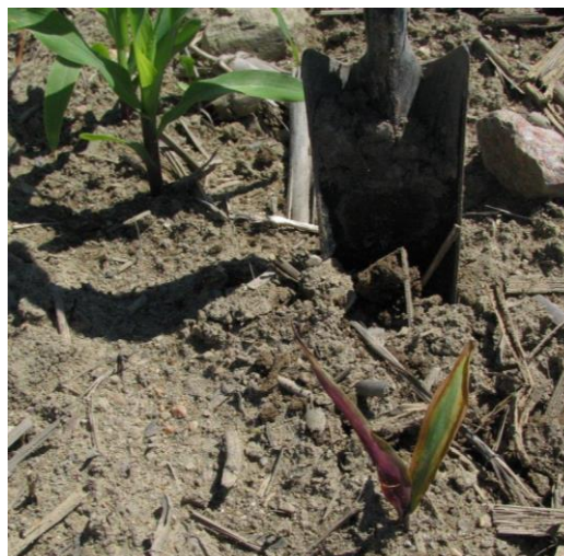
Figure 14 : Plant rabouгри et mauve dû à la fonte des semis