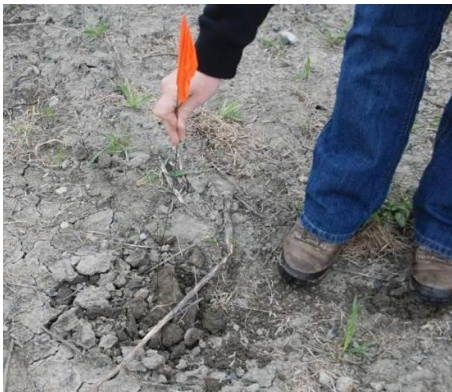
Figure 3 : Enterrement de l'appât et installation du drapeau