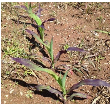
Figure 15 : Plants de maïs mauves dû à un excès d'eau et au froid