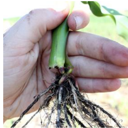
Figure 8 : Plant coupé par un ver-gris noir