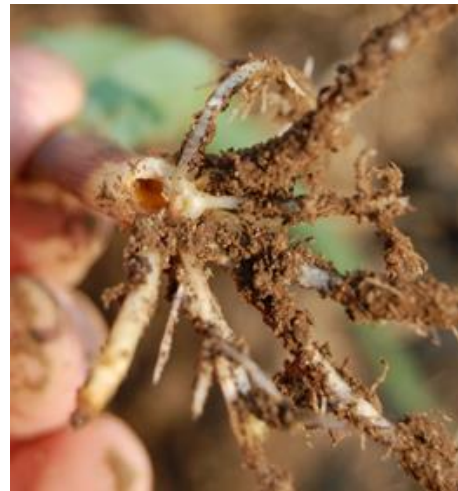
Figure 10 : Trou laissé par le perce-tige de la pomme de terre