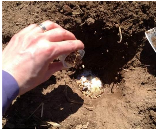
Figure 2 : Dépôt de l'appât au fond du trou