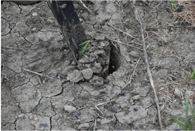
Figure 1 : Creusage du trou