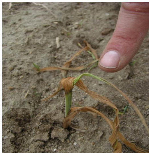
Figure 2 : Plant flétri dû à un ver fil-de-fer