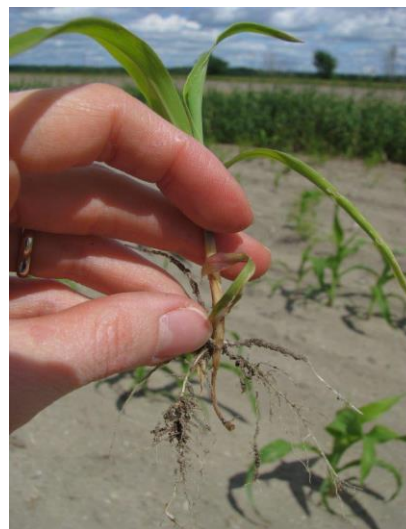
Figure 4 : Racines grugées par un ver fil-de-fer