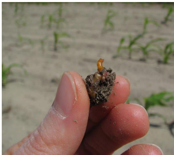
Figure 3 : Présence d'un ver fil-de-fer dans un grain de maïs