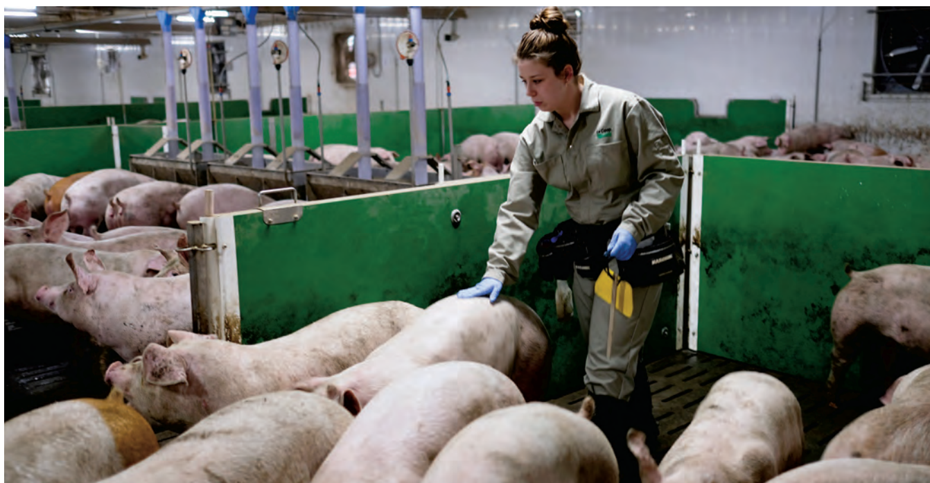
Le programme de formation en milieu de travail dure environ 18 mois.