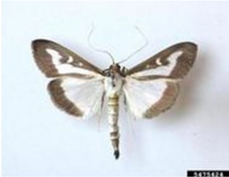
Adulte de la pyrale du buis