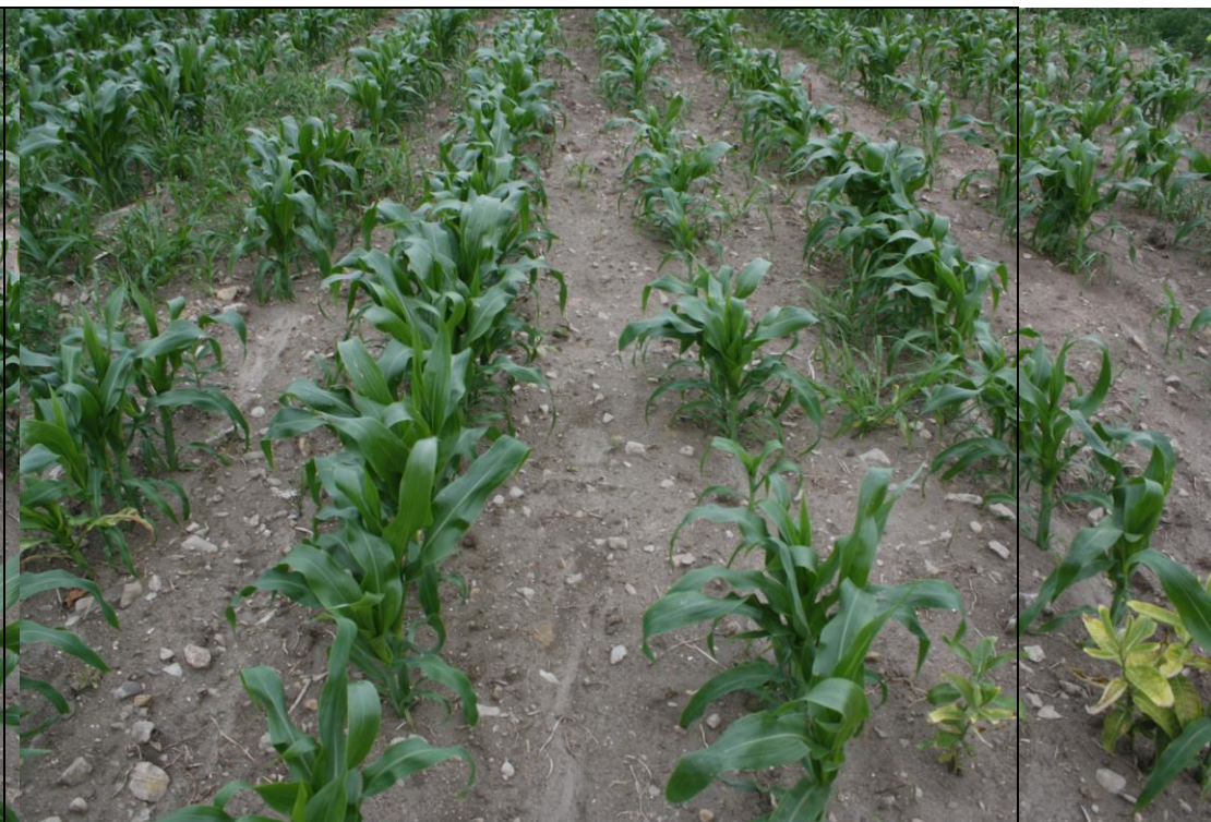
Photo 17. Traitement ACURON (no. 5), maïs sucré frais semé pleine terre (Neuville, 2020/07/16).