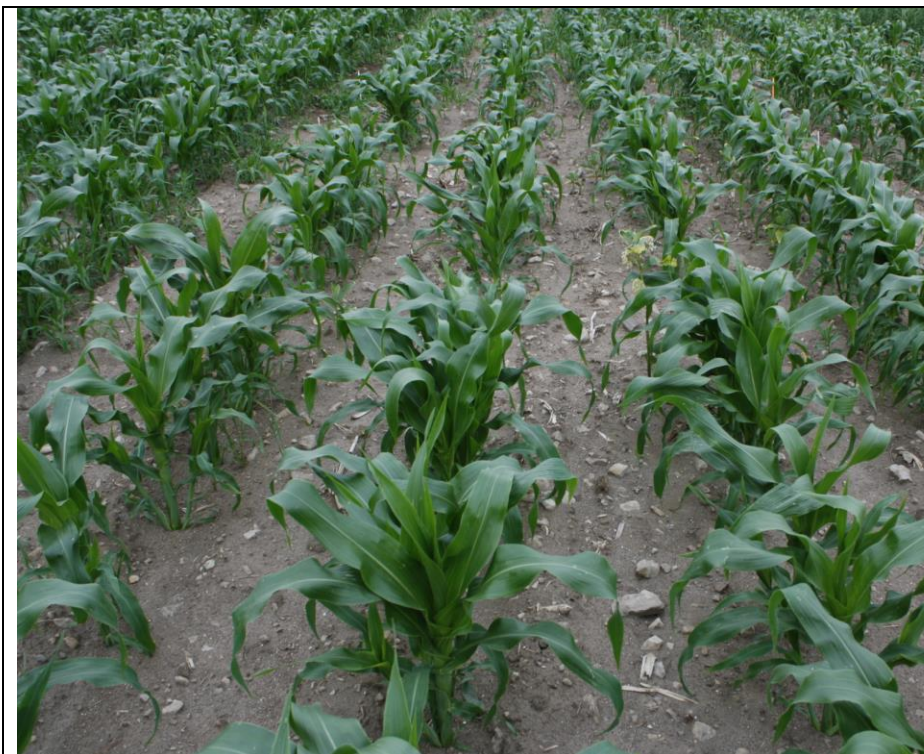
Photo 16. Traitement DUAL II MAGNUM + CALLISTO 480SC suivi d'ARMEZON AATREX LIQUID 480 (no. 4), maïs sucré frais semé pleine terre (Neuville, 2020/07/16).