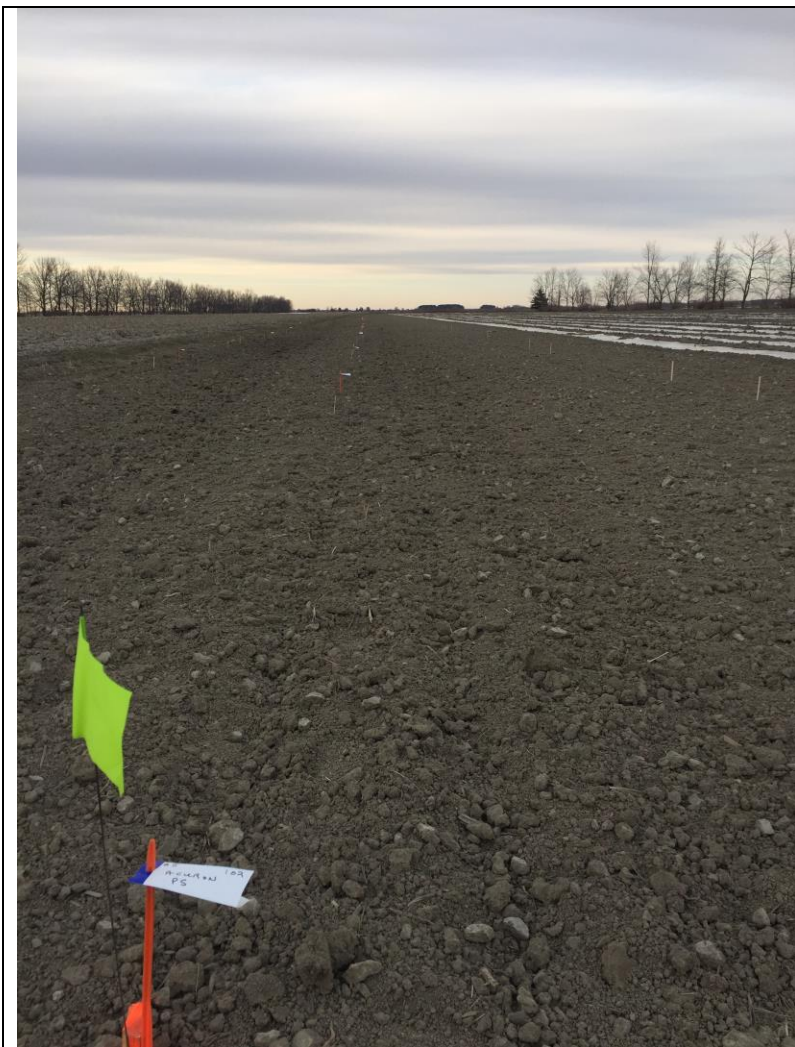
Photo 5. Conditions du terrain avant l'application des traitements de présemis dans le maïs sucré frais sous paillis plastique (St-Damase, 2020/04/24).