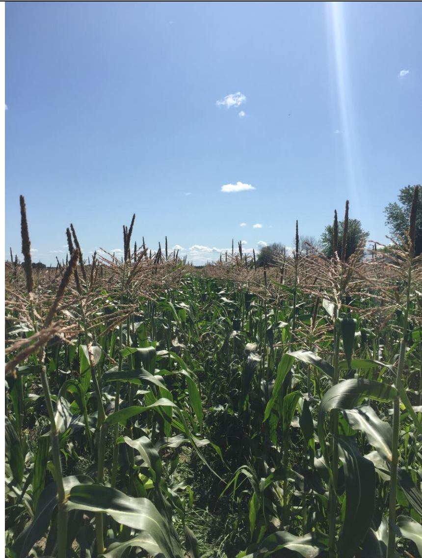
Photo 3. Entrerang enherbé au moment de la récolte dans le maïs sucré de transformation (St-Barnabé, 2019/08/15).