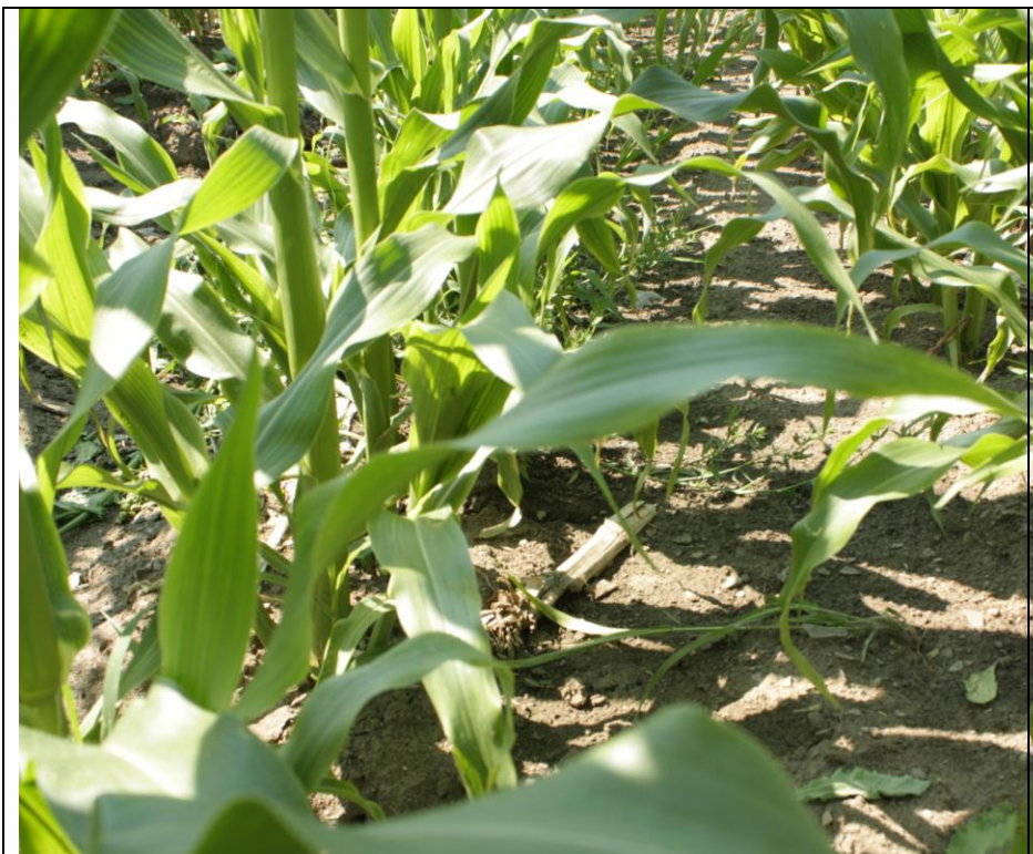
Photo 13. Traitement ACURON FLEXI (no. 6), maïs sucré frais sous paillis plastique (Neuville, 2020/07/01).