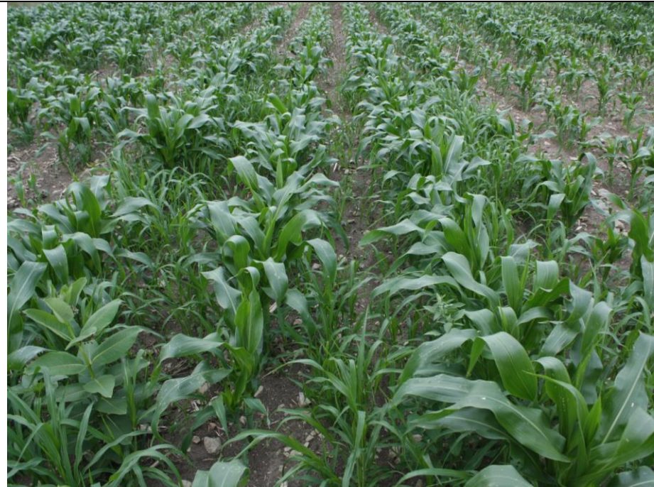
Photo 18. Traitement ACURON FLEXI (no. 6), maïs sucré frais semé pleine terre (Neuville, 2020/07/16).