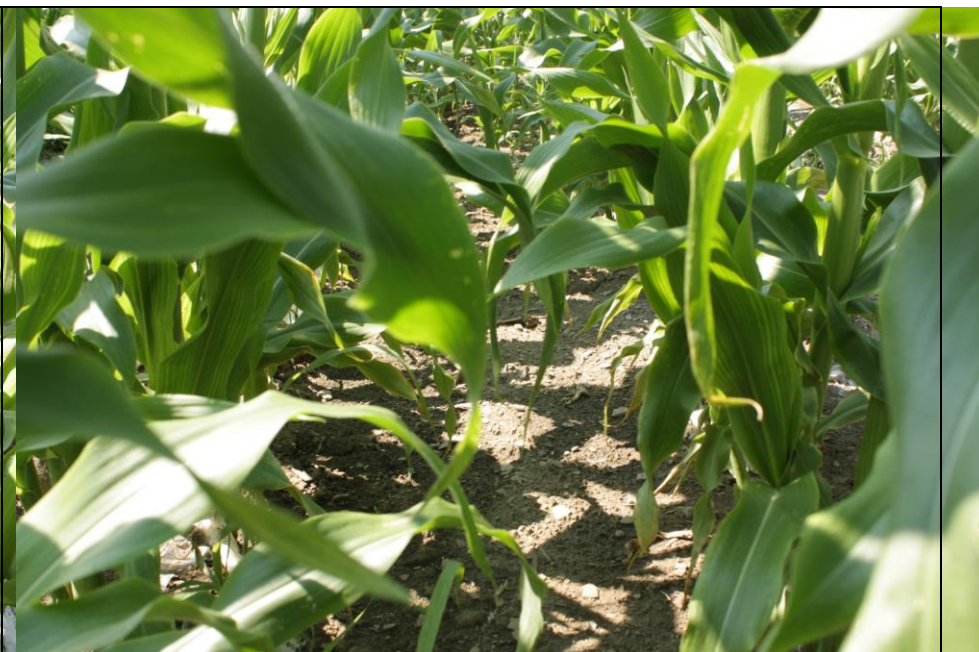
Photo 10. Traitement PRIMEXTRA II MAGNUM + CALLISTO 480SC (no. 3), maïs sucré frais sous paillis plastique (Neuville, 2020/07/01).