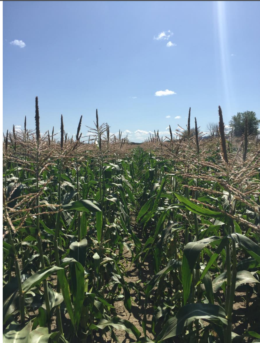
Photo 4. Entrerang désherbé au moment de la récolte dans le maïs sucré de transformation (St-Barnabé, 2019/08/15).