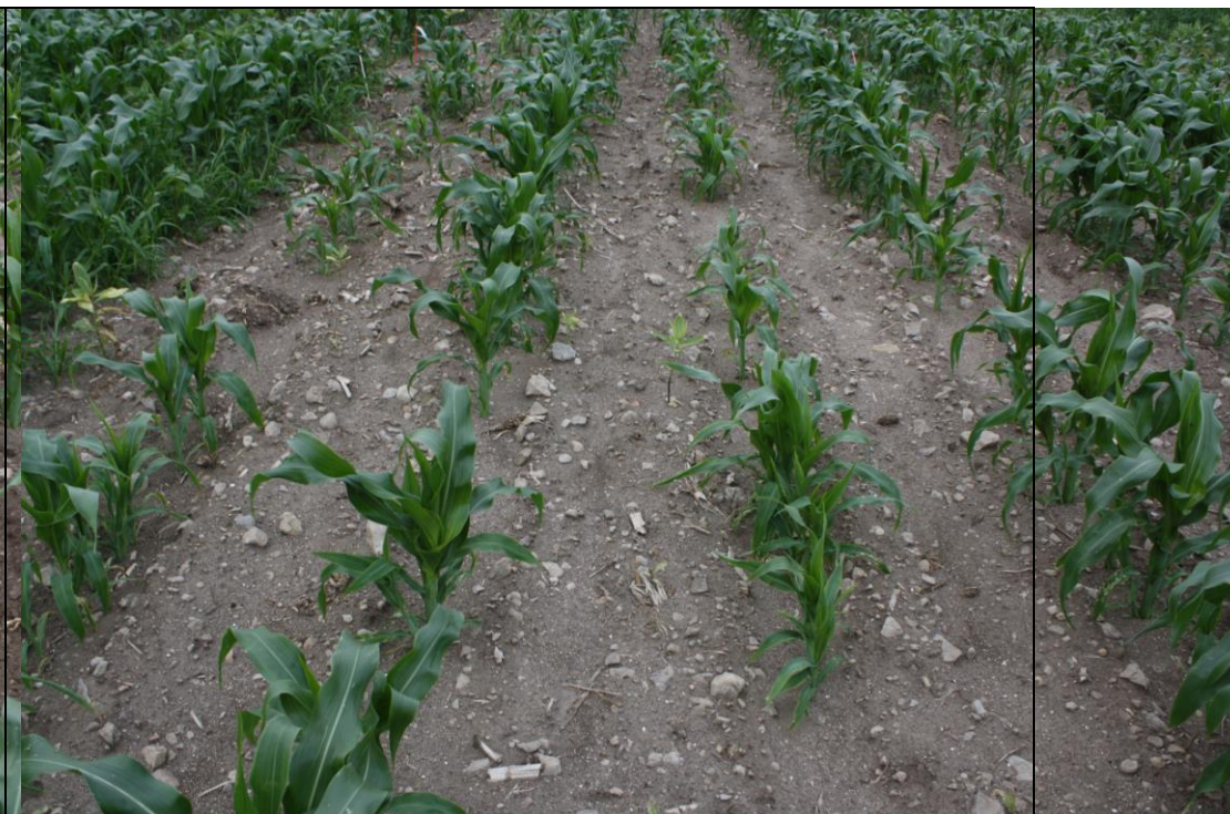
Photo 20. Traitement DUAL II MAGNUM + CALLISTO 480SC suivi d'ACCENT IS + PARDNER (no. 9), maïs sucré frais semé pleine terre (Neuville, 2020/07/16).