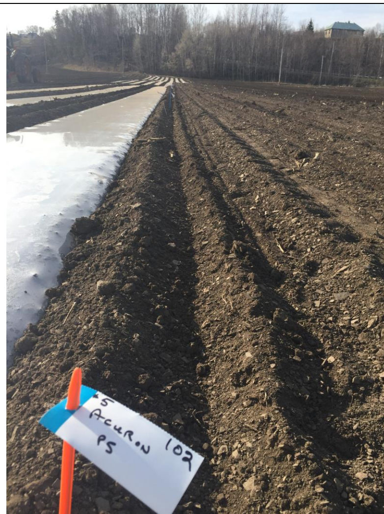
Photo 6. Conditions du terrain avant l'application des traitements de présemis dans le maïs sucré frais sous paillis plastique (Neuville, 2020/04/29).