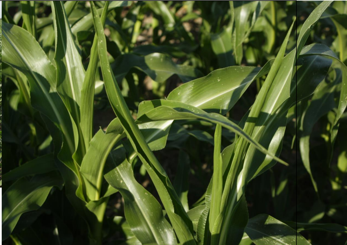
Photo 24. Dommages de MCPA (no. 10), maïs sucré de transformation (St-Jude, 2020/07/31).