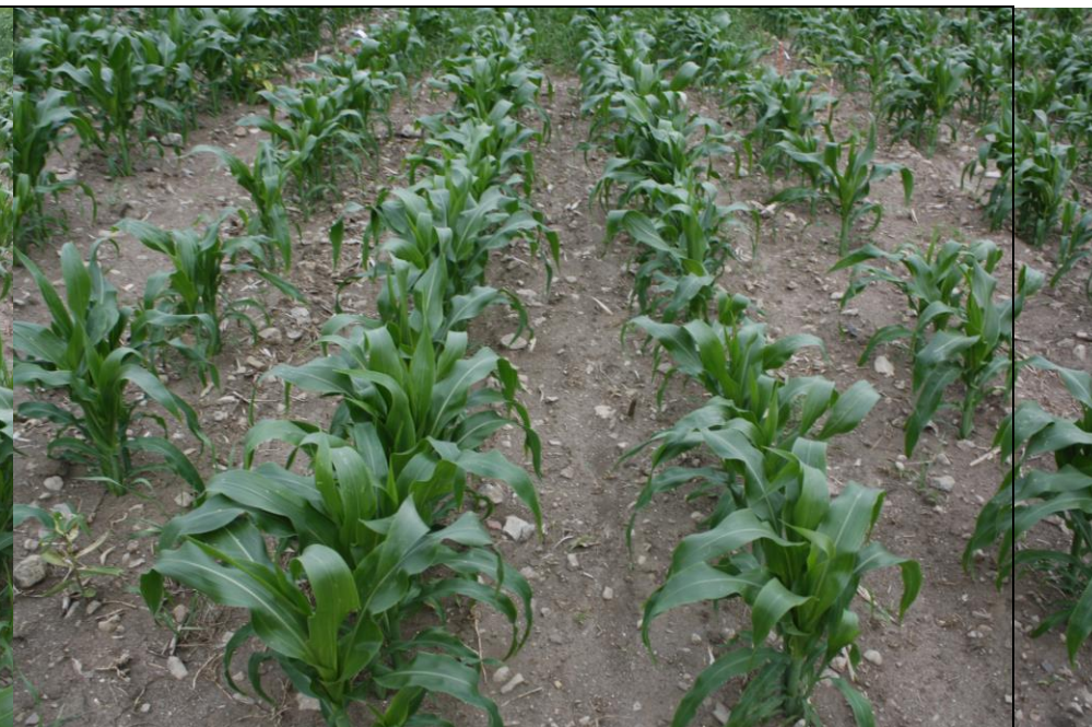
Photo 14. Traitement ERAGON + DUAL II MAGNUM (no. 2), maïs sucré frais semé pleine terre (Neuville, 2020/07/16).