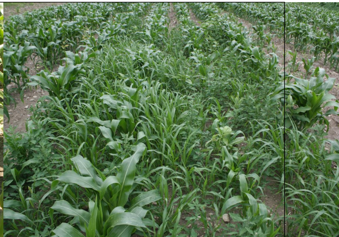
Photo 14. Traitement témoin enherbé (no. 1), maïs sucré frais semé pleine terre (Neuville, 2020/07/16).