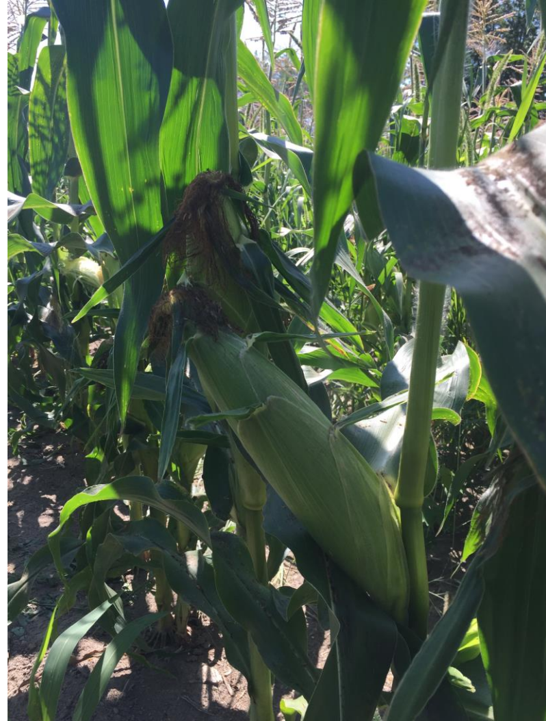
Photo 2. Épis de maïs sucré de transformation sur le plant au moment de la récolte (St-Barnabé, 2019/08/15).