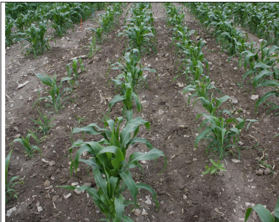
Photo 19. Traitement INTEGRITY suivi d'un sarclage (no. 8), maïs sucré frais semé pleine terre (Neuville, 2020/07/16).