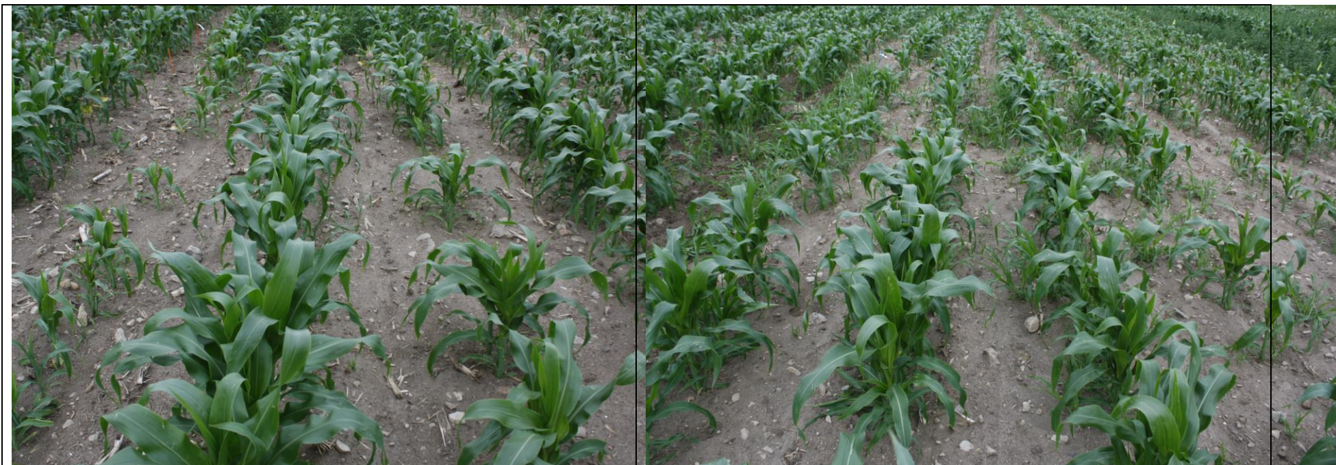
Photo 21. Traitement INTEGRITY suivi d'ARMEZON + AATREX LIQUID 480 (no. 10), maïs sucré frais semé pleine terre (Neuville, 2020/07/16).