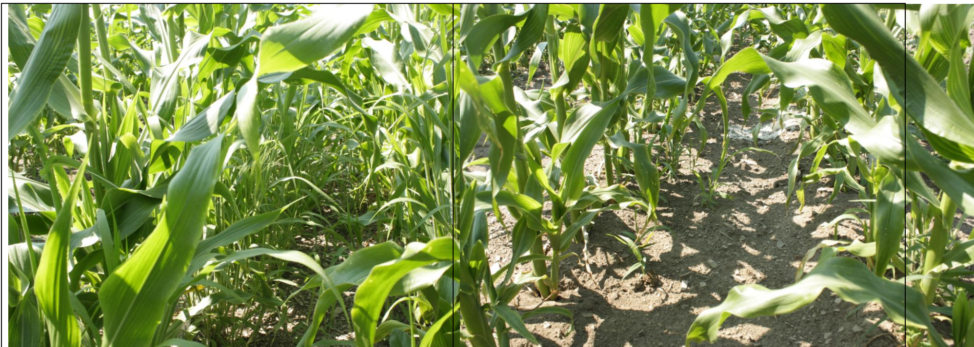
Photo 11. Traitement DUAL II MAGNUM + CALLISTO 480SC (no. 4), maïs sucré frais sous paillis plastique (Neuville, 2020/07/01).