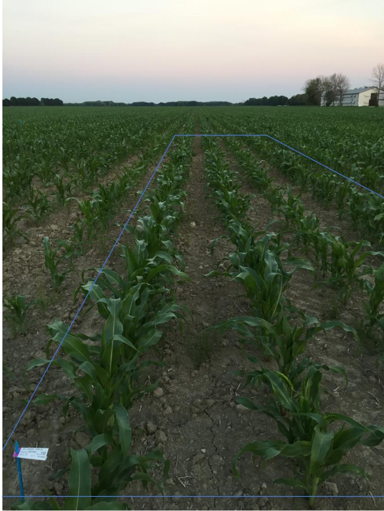
Photo 1. Représentation visuelle d'une parcelle de maïs de transformation (4 rangs de large par 10 m de long) (St-Barnabé, 2019)