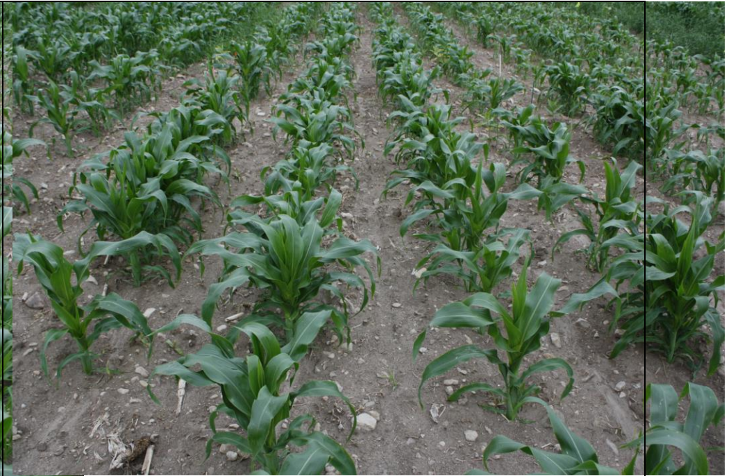
Photo 19. Traitement INTEGRITY suivi d'ACCENT IS + CALLISTO 480SC (no. 7), maïs sucré frais semé pleine terre (Neuville, 2020/07/16).