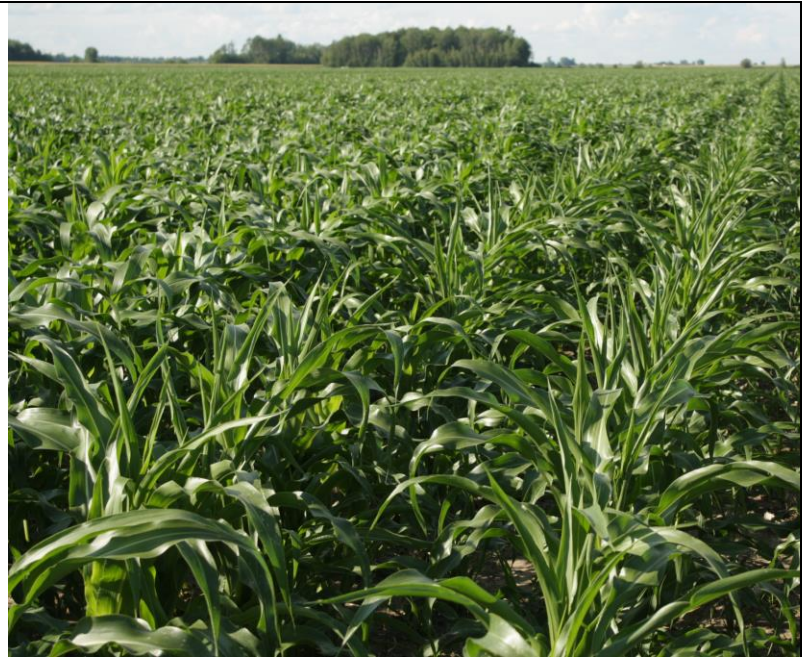
Photo 23. Dommages de MCPA (no. 10), maïs sucré de transformation (St-Jude, 2020/07/31).