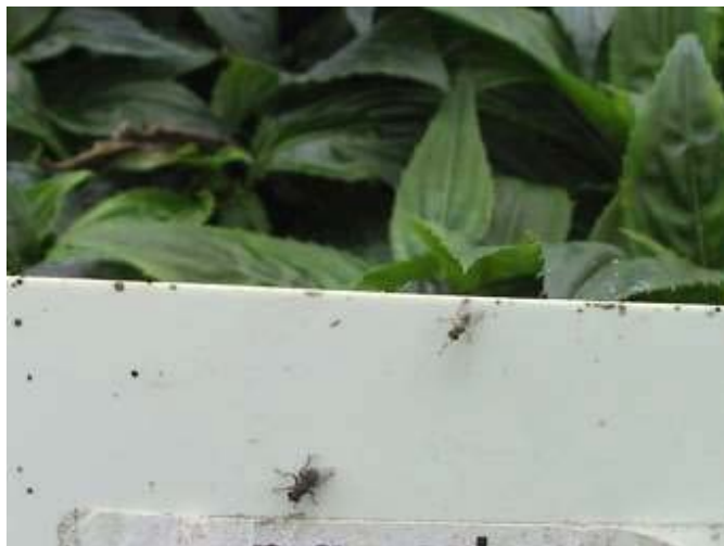
Photo 14 : femelle (en bas et plus grande) et mâle (en haut et plus petit) de Coenosia attenuata perchés sur une étiquette