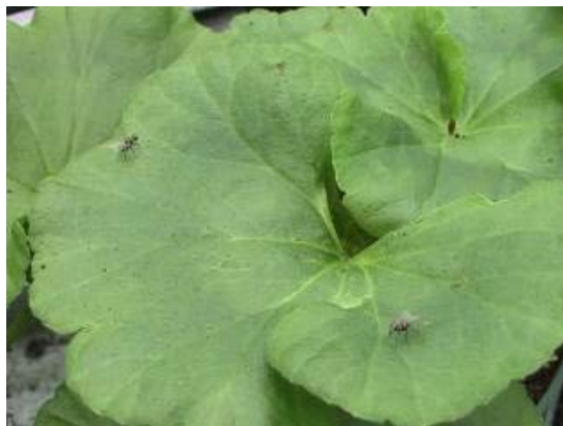
Photo 16 : deux adultes de Coenosia sur une feuille de géranium zonal