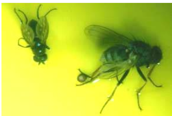
Photo 10 : mouche du rivage (à gauche) et femelle de Coenosia (à droite)

Quant à la larve , elle se développe dans le terreau tout comme celle de la mouche noire, ses proies favorites. Elle serait très difficile à repérer dans le terreau même en présence de populations élevées d'adultes (Graeme Murphy, communication personnelle). Contrairement à l'adulte, elle n'est nullement chasseuse. Étrangement, si une larve lui passe le long du corps, elle ne s'en préoccupe pas. Elle a plus de chance de tomber sur des larves de derniers stades, plus grosses. Elle semble plutôt s'intéresser à sa proie uniquement lors d'un face à face. C'est à ce moment qu'elle lui siphonne l'intérieur du corps. Elle s'intéresse aussi très peu aux œufs (trop petits) et aux pupes (trop coriace).