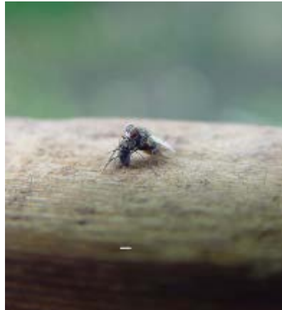
Photo 2 : femelle de Coenosia qui s'alimente de la mouche du rivage Scatella stagnalis (Bar = 1 mm)