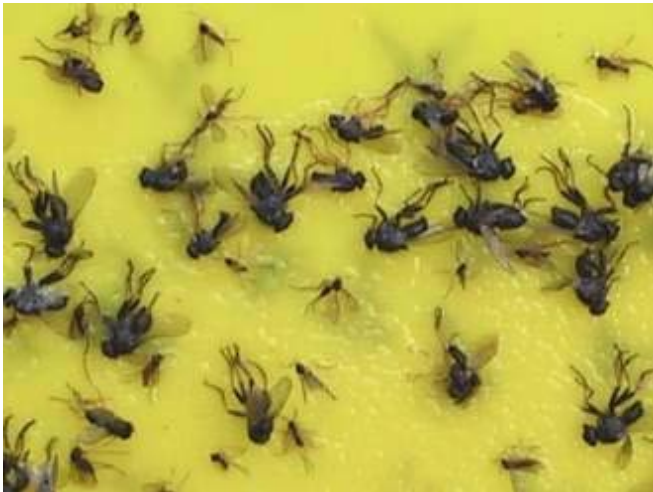
Photo 6 : adultes de Coenosia et de sciarides plus petites sur piège collant