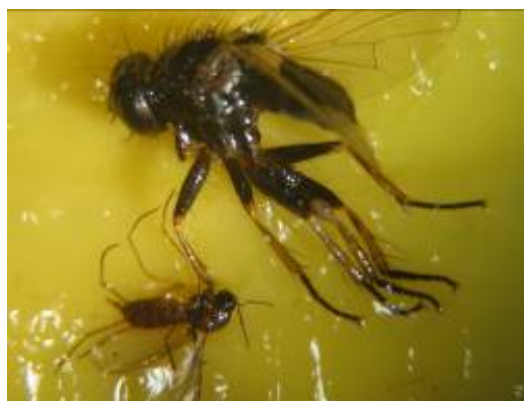
Photo 11 : sciaride (en bas) et femelle de Coenosia (en haut)