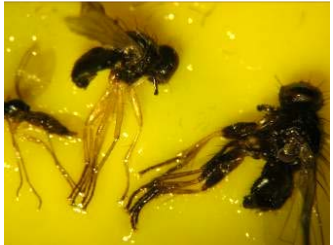
Photo 7 : de gauche à droite : adulte de sciaride, mâle (pattes entièrement jaunes) et femelle (pattes noires et jaunes) de Coenosia