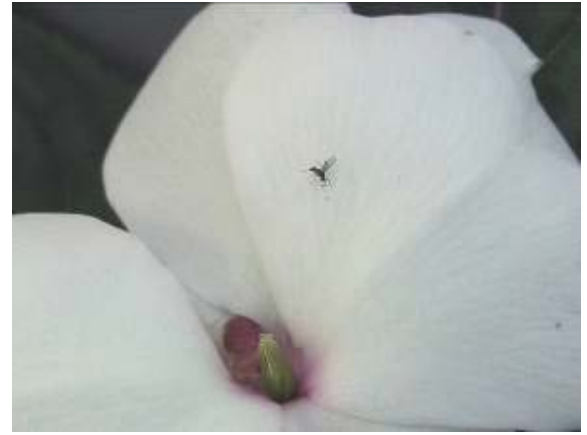
Photo 3 : cadavre de sciaride sur une fleur d'impatiens de Nouvelle-Guinée