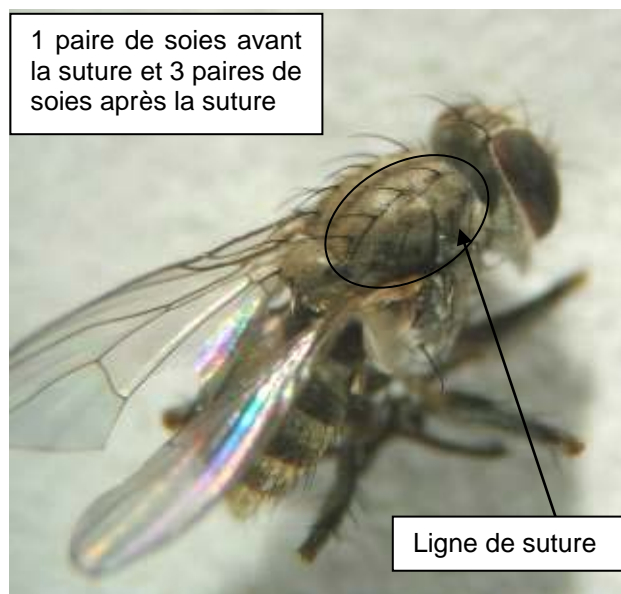
Photo 9 : disposition des paires de soies, avant et après la ligne de suture