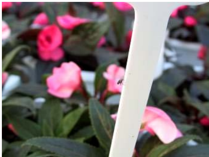
Photo 13 : femelle de Coenosia attenuata perchée sur le bord d'une étiquette

L'Université de Cornell poursuit ses recherches dans l'espoir de développer une diète d'élevage commercial. L'usage de plantes réservoirs sera une autre avenue intéressante pour augmenter une population existante en serre et lui permettre de s'établir facilement. Il reste encore beaucoup à apprendre sur sa biologie et son comportement, mais on sait déjà qu'elle est fort appréciée des serristes qu'elle côtoie et que c'est un véritable cadeau!