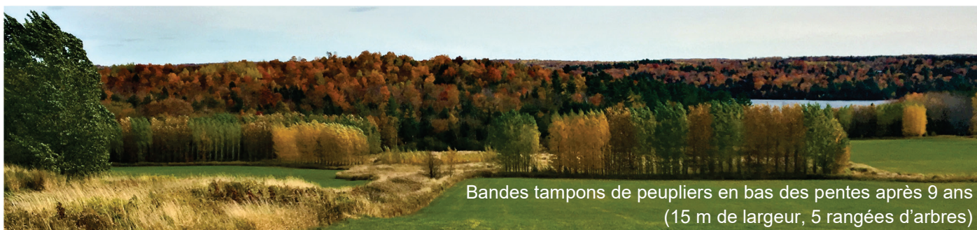
Bandes tampons de peupliers en bas des pentes après 9 ans (15 m de largeur, 5 rangées d'arbres)

Le peuplier hybride est une espèce de choix pour l'aménagement de bandes tampons élargies dédiées à la production de biomasse énergétique. Localisées en bordure des champs cultivés, ces bandes d'arbres multifonctionnelles peuvent produire, en moins de 10 ans, plusieurs services écosystémiques (séquestration du carbone, captage des nutriments, production de biomasse et de bois, stabilisation du sol, amélioration du microclimat, régulation hydrologique, corridors et refuges pour la faune et la flore, territoire de chasse au cerf de Virginie). De plus, en produisant du bois dans de tels systèmes agroforestiers, la pression de coupe est réduite dans les boisés naturels de ferme, ce qui crée des opportunités pour la conservation forestière. Sur des sites moyennement fertiles, des rendements en bois de l'ordre de 25 m 3 /ha/an sont obtenus après 8 ans dans des bandes de 15 m de largeur. Ces bandes stockent alors environ 40 tonnes de carbone, 180 kg d'azote et 25 kg de phosphore par hectare dans la biomasse ligneuse aérienne. En utilisant des plants de fortes dimensions (hauteur > 1,8 m), les peupliers peuvent être plantés sans protection anti-cervidé.