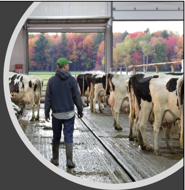
Nombre de vaches et capacité de l'étable