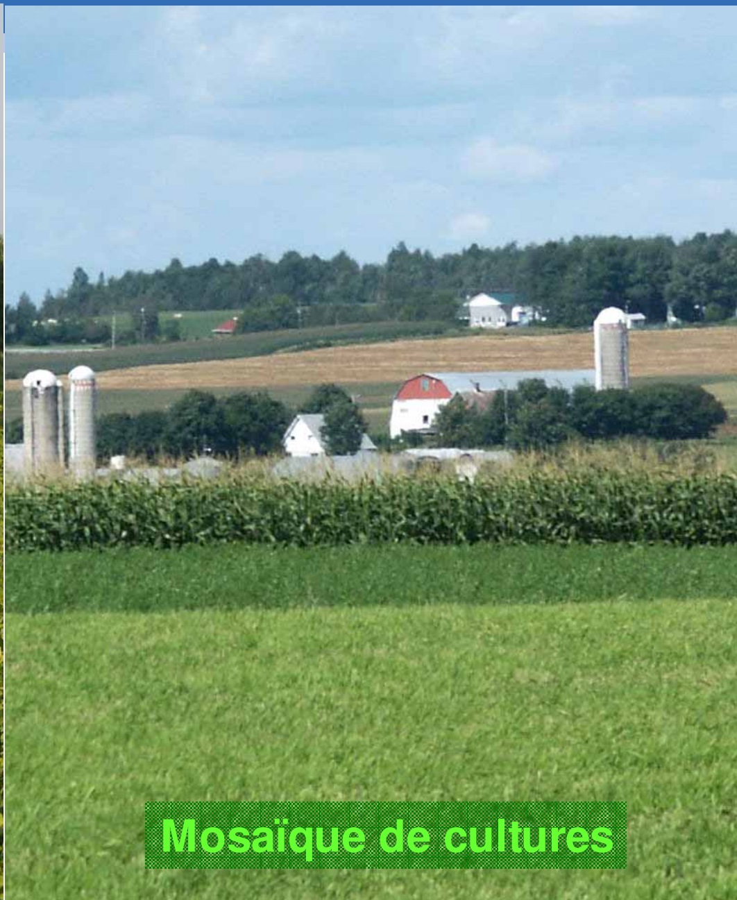
Mosaïque de cultures