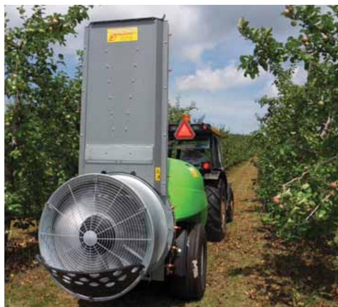
Pulvérisateur à jet porté