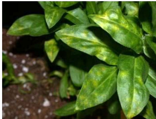
Photo : Marbrures, taches jaunes et gaufrage des feuilles.