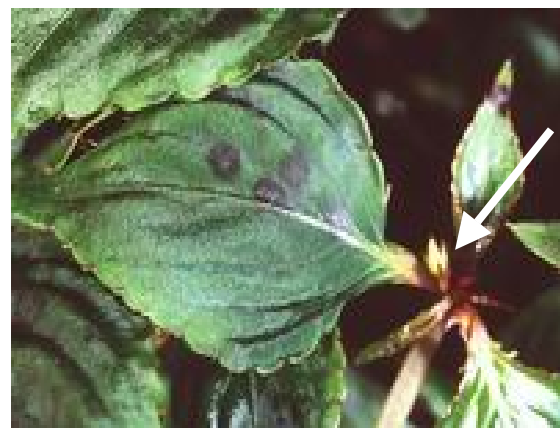
Photos 3-4 : Taches foliaires en forme d'anneaux apparaissant souvent parmi les taches noires.