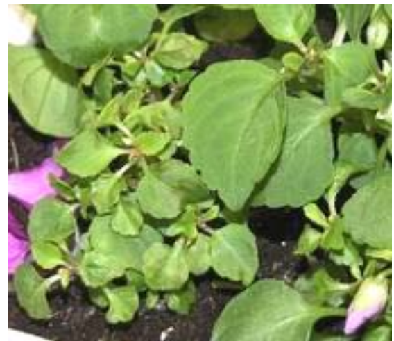
Photo 1 : Impatiens de Nouvelle-Guinée avec taches noires associées de jaunissements.