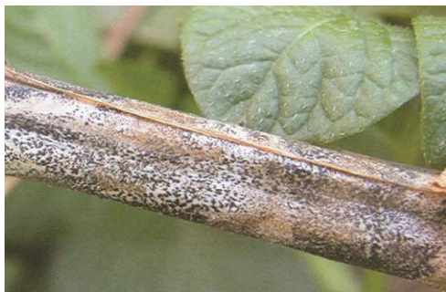
Microsclérotos sur tige.

Au fur et à mesure que les tissus infectés meurent, les acervules et les microsclérotos peuvent devenir très abondants et couvrir la surface entière de la tige ainsi que l'intérieur de celle-ci. Les tissus internes deviennent floconneux et se détachent facilement.