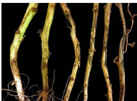
Évolution des symptômes de dartoise à la base des tiges

À la base des tiges et aux collets, la maladie peut aussi être confondue avec la rhizoctonie dans les premiers stades de son développement. Elle est toutefois facilement identifiée lorsque les fructifications caractéristiques (sclérotos) sont remarquées, le plus souvent sur les racines, les stolons et la base des tiges.