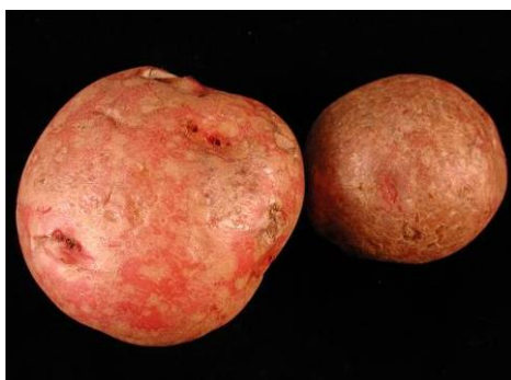
Symptômes de dartoise sur tubercules.

À la récolte, les tubercules peuvent ou non apparaître ternes et rugueux et nous risquons de confondre la dartoise avec la tache argentée.