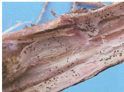
Microsclérotos à l'intérieur de tige.

À la base des tiges et aux collets, la maladie peut aussi être confondue avec la rhizoctonie dans les premiers stades de son développement. Elle est toutefois facilement identifiée lorsque les fructifications caractéristiques (sclérotos) sont remarquées, le plus souvent sur les racines, les stolons et la base des tiges.