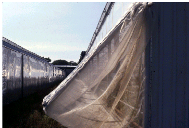
Photo 12 : Moustiquaire installée sur le côté ouvrant d'une serre.