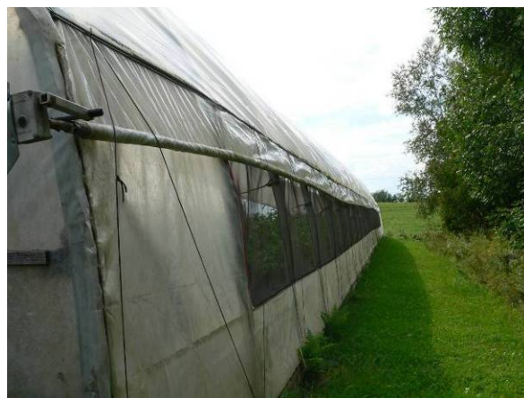
Photo 9 : Moustiquaire installée sur le côté ouvrant d'une serre individuelle.