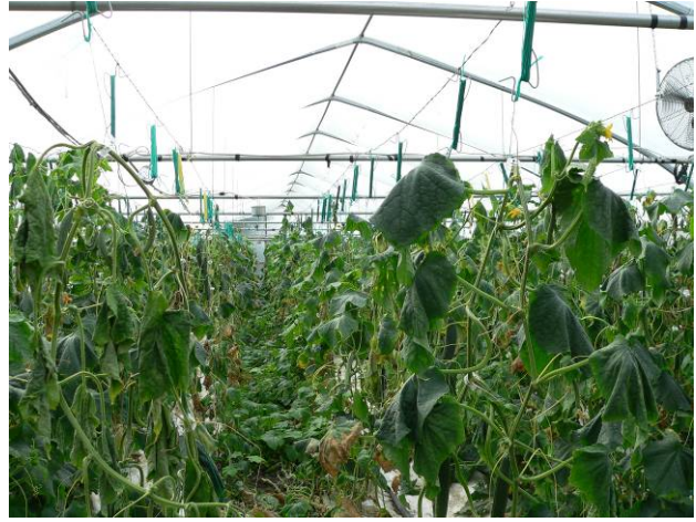
Photo 2 : Serre complètement dévastée par la flétrissure bactérienne propagée par la chrysomèle rayée du concombre.