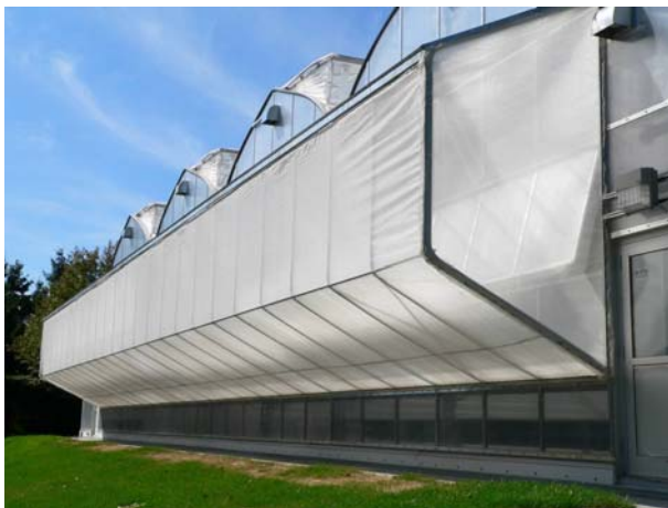
Photo 15 : Serres de recherche de l'Environnement de l'Université Laval à Québec; ces serres sont « à l'épreuve des insectes », même des thrips. On peut distinguer la moustiquaire en accordéon sur les toits ouvrants et la boîte de ventilation avec moustiquaire sur le bout des serres.