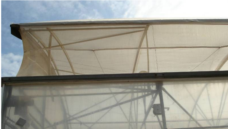
Photo 6 : Moustiquaire « Ultravent » installée en ventilation à la gouttière.

Note : au Québec, il est possible d'obtenir l'équivalent de l'« Ultravent » fabriqué en France; demandez à votre fournisseur.