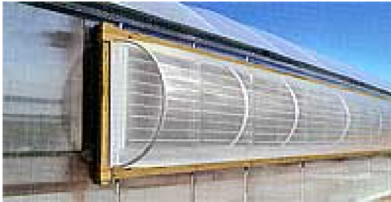
Photo 7 : Surface d'entrée d'air arrondie et recouverte d'une moustiquaire; cette surface arrondie est environ 1,6 fois plus grande que l'ouverture originale.

La principale chose à regarder est l'effet de la moustiquaire sur la ventilation. Il faut compenser la restriction en agrandissant la surface des entrées d'air.