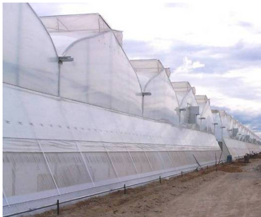
Photo 11 : Structure en porte-à-faux recouverte d'une moustiquaire sur le bout des serres jumelées.