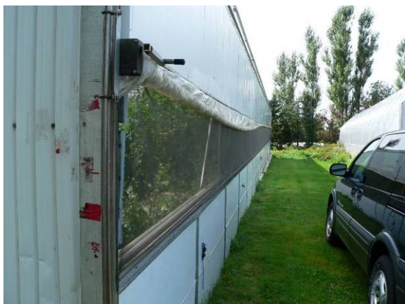
Photo 8 : Moustiquaire installée sur le côté ouvrant d'une serre jumelée.