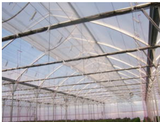
Photo 14 : Autre façon d'installer une moustiquaire pour une ventilation naturelle au toit; la moustiquaire fait un genre de demi-cercle à l'intérieur de la serre.