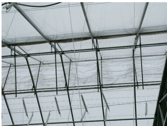
Photo 13 : Moustiquaire installée sur la ventilation naturelle au toit; ici, l'ouvrant est ouvert au maximum afin que l'on puisse mieux distinguer la moustiquaire pour la photo.

Durant les périodes chaudes, il se pourrait que l'ajout de ventilateurs et d'entrées d'air avec moustiquaire soit nécessaire.