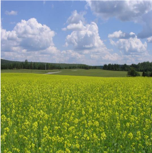
Photo : Moutarde brune

Récemment, l'utilisation d'engrais verts ou de rotations à base de plantes de la famille des Brassica spp. (canola, moutarde, colza, chou, etc.) suscite beaucoup d'intérêt. Ces plantes contiennent des produits soufrés, appelés glucosinolates, qui sont relâchés dans le sol lorsque la plante est hachée, puis enfouie rapidement. Certains micro-organismes du sol possèdent un enzyme qui dégrade les glucosinolates pour produire un gaz, l'isothiocyanate, toxique pour les organismes du sol. Cette réaction, appelée biofumigation, peut aussi être obtenue avec des amendements à base de crucifères (granules de crucifères, tourteaux de colza, etc.).