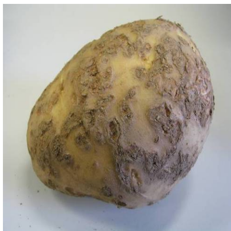
Photo : Symptômes de gale commune

Les agents pathogènes responsables de la gale commune sont des bactéries appartenant au genre des Streptomyces . Il s'agit de bactéries saprophytes, se nourrissant de matière organique en décomposition, qui ont la capacité de produire des antibiotiques. Elles se reproduisent via la production de spores pouvant survivre dans le sol durant une longue période (plus de 10 ans), et ce, même en l'absence de pommes de terre. Plusieurs espèces de Streptomyces sont présentes dans les sols et la majorité ne sont pas phytopathogènes. Au moins 7 espèces de Streptomyces ont été reconnues pour causer la gale commune dont : S. scabiei , S. acidiscabiei , S. turgidiscabiei , etc. Toutefois, l'espèce dominante demeure S. scabiei et de nombreuses souches de cette espèce ont été identifiées avec des niveaux de virulence pouvant varier entre elles.