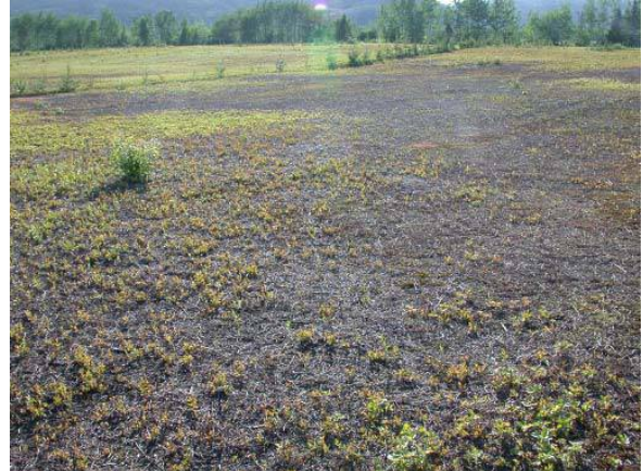
Figure 1b : Dommages au champ.

L'altise du bleuet produit une génération par an. Elle présente quatre stades de développement : l'oeuf, la larve, la puppe et l'adulte (figure 2). Elle passe l'hiver au stade oeuf dans la litière en surface du sol. Les oeufs orange-jaune et de forme ovale mesurent environ 1 mm de longueur. Ils éclosent sur une période de 2 à 3 semaines au printemps.