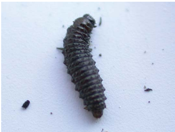
Figure 3 : Larve de l'altise.