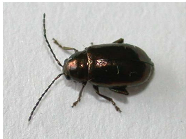
Figure 4 : Altise au stade adulte.