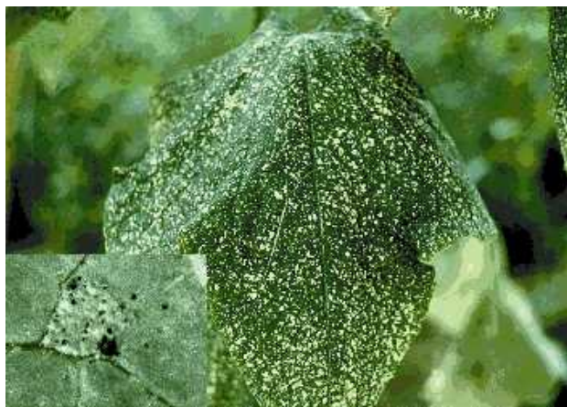
Photo 3 : dégâts de thrips sur feuillage de concombre; en encadré : excréments (points noirs) de thrips.