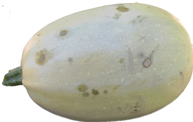
Taches bactériennes causées par Pseudomonas syringae sur courge spaghetti.