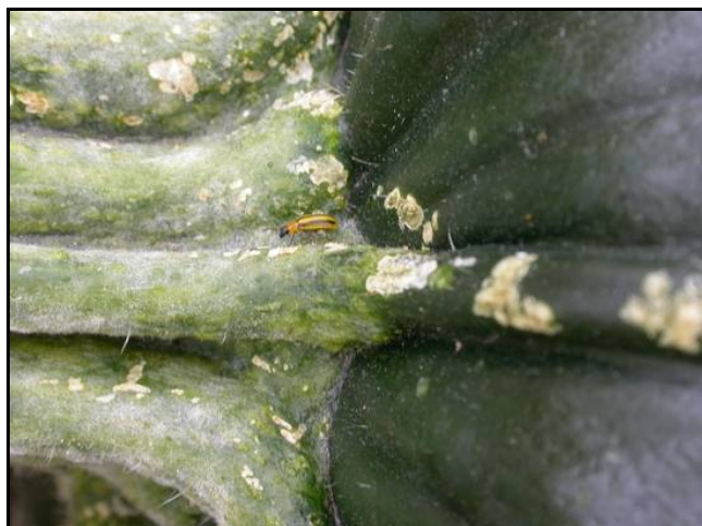
Grignotage de chrysomèles sur fruit de citrouille.