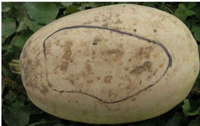
Lésions superficielles causées par Fusarium sp. sur la courge spaghetti.

Des taches bactériennes ont aussi été observées sur les courges spaghetti. Ces lésions semblent fermes sur le fruit, mais lorsqu'on le coupe, on constate que la pourriture s'étend dans la chair du fruit et peut atteindre la cavité renfermant les graines. Faites attention à ces lésions, car bien qu'elles soient souvent de petites tailles, il est fort possible qu'en entreposage, elles provoquent la détérioration rapide des courges.