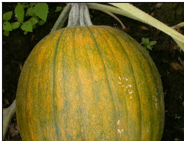
Les dégâts sont superficiels et essentiellement d'ordre esthétique.

Si vous jugez que la situation nécessite une intervention insecticide, assurez-vous de l'absence de pollinisateurs. Évitez d'utiliser les mêmes matières actives que celles employées au printemps, afin de limiter l'apparition de résistance chez la chrysomèle rayée du concombre. Une pulvérisation de lambda-cyhalothrine (MATADOR 120 EC ou WARRIOR, deux insecticides nouvellement homologués dans les cucurbitacées) pourrait effectuer un bon contrôle. À des températures supérieures à 25 °C, l'efficacité des pyréthrinoïdes peut toutefois diminuer.