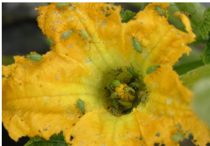
Présence de nombreuses chrysomèles dans une fleur de courge.